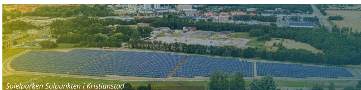
Solelparken Solpunkten i Kristianstad

HÖR AV ER TILL OSS OM NI VILL VETA MER OM HUR NI KAN VARA MED OCH BYGGA MORGONDAGENS HÅLLBARA ENERGISYSTEM